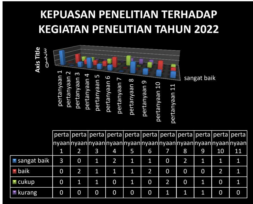
Gambar 1. Grafik Kepuasan Peneliti terhadap Penelitian

Tingkat kepuasan pengguna ditentukan dengan mencari rata-rata dari semua item pada masing-masing kategori. Perhitungan tingkat kepuasan peneliti adalah sebagai berikut: